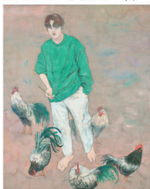
「薩摩地鶏図」黒脇啓太郎